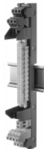
BP 902-21 mit einem Steckplatz